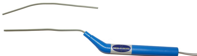
Modello in acciaio malleabile, frequenza 20 MHz

Necessitano di relativo amplificatore serie BDP.